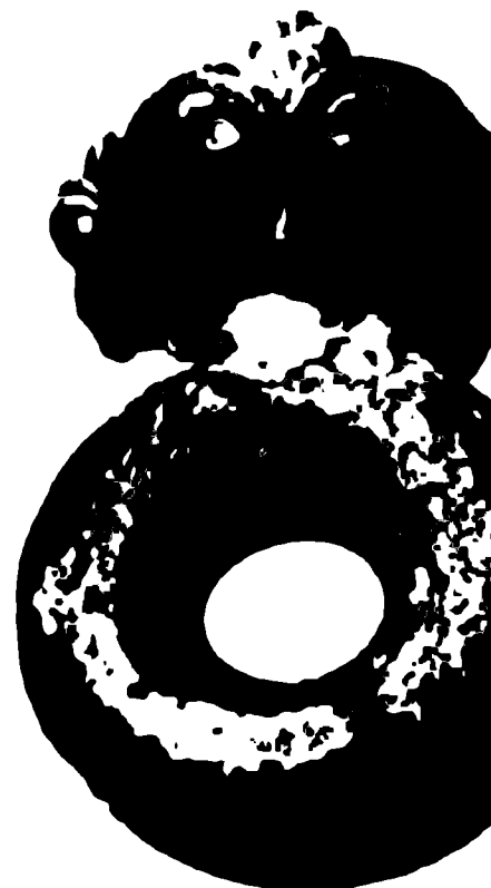
Бронзовая деталь упряжки колесницы. Мезек, Болгария, III век до новой эры.

Одни исследователи объясняют это единство спецификой хозяйственной деятельности кельтов, пастухов овец и свиней, а потому приспособленных и привыкших к далеким пешим переходам. Другие считают, что в кельтской среде были группы бродячих мастеров-ремесленников, переходивших от одного пле-