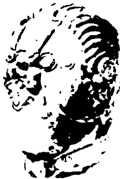
Каменная голова кельта из Мшецке-Жехровице, Чехия, III—II века до новой эры.

В какой-то мере может помочь археология. Благодаря ей мы получаем представления об обыденной бытовой стороне жизни, и представления эти могут быть довольно полными. Если же пойдем дальше и попробуем сопоставить скудные сведения древних авторов (описывавших лишь те эпизоды, когда кельты непосредственно сталкивались с античным миром) с данными археологии, мы сможем реконструировать в какой-то мере и ход событий, хотя, конечно, без подробностей, так украшающих историю, часто даже без имен и дат. И все-таки... От этого привлекательность кельтов не уменьшается.