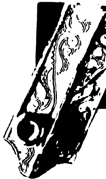
Гравировка «стиля красивых мечей». Ирландия.

М. Щукин. Снова о Чеширском Коте и его улыбке