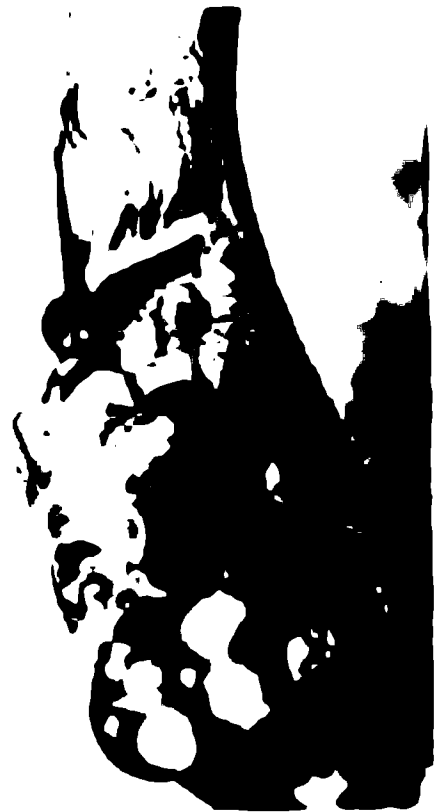
Золотой браслет. Деталь. Рейнхайм. Германия, конец V — начало IV века до новой эры.