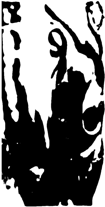
бронзовая грифна. Деталь. Шулли, Франция. IV век до новой эры.

Если мы хотим почувствовать дух эпохи или «нерв» народа, следует обратиться к искусству. Лишь оно передает это наиболее адекватно. Впечатления, правда, трудно перевести на язык слов. Но иногда этого и не надо. Достаточно пройти по кельтским экспозициям любого из европейских музеев или пролистать книги-альбомы по искусству и культуре кельтов, как понимаешь, что попал в мир фантастический, невероятный. Впечатление такое, как при переходе из зала «Передвижников» в залы авангарда.