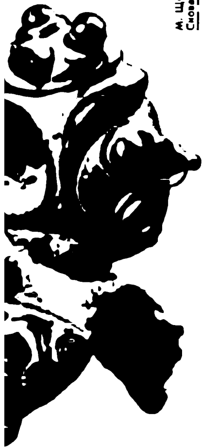
Бронзовая деталь упряжки колесницы. Франция, III век до новой эры.

мени к другому и всюду оставивших свои изделия. Возможно. Но нужно учесть еще одно обстоятельство.