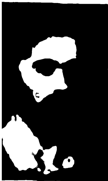
Друид из Линдоу Мосс. Реконструкция по Яну Стеду. Британский музей.

В 1984 году общественность Чешира, а затем и всей Англии была взволнована криминальной историей. Заготовители торфа в болоте Линдоу Мосс, между Ливерпулем и Манчестером, обнаружили труп человека. Вызвали полицию и, к счастью археологов, труп извлекли вместе с окружающим торфом, то есть монолитом, и подвергли самому тщательному исследованию. Погиб человек ужасно. Был задушен гарротой, в данном слу-