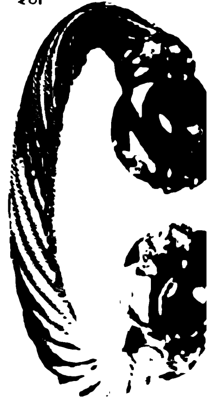
Золотая гривна. Снеттсхэм. Англия, середина I века до новой эры.

М. Шукки. Слова о Чарльзском Коте и его улыбке