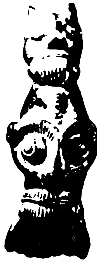
Бронзовая фибула. Обервиттенхансен, Германия, конец V — начало IV века до новой эры.

Но у них был опытный и хладнокровный полководец Светий Паулин. Он-то и спас римлян. Пожертвовав из стратегических соображений Лондоном, он сумел сконцентрировать силы легионов, удачно выбрать место для битвы и разбить войско