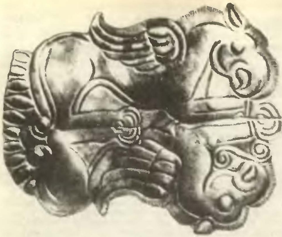
Бляшка из клада в Луковите.