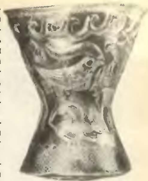
Кубок из Хаджикиоле.

Мы плохо осведомлены о дальнейших делах в Дакии в конце I века до новой эры. Знаем, что некий Косон выпустил золотую монету со своим именем, но с портретом Марка Брута,