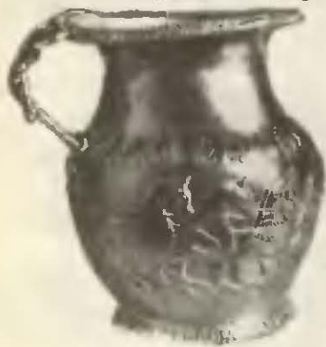
Золотой сосудик из Враца.