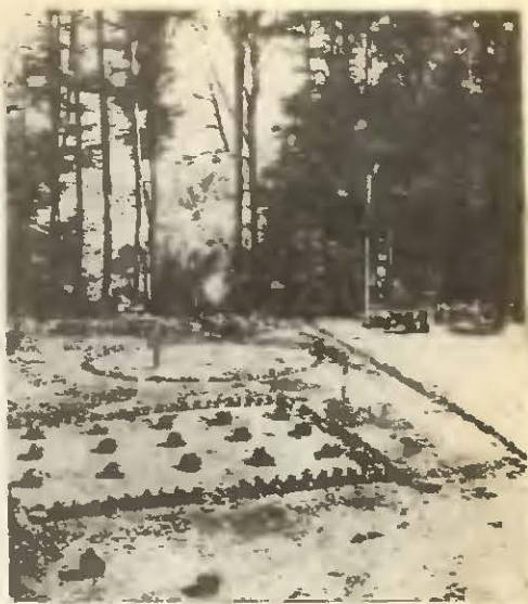
Остатки храмов и святилищ Сармизегетузы.

А с кельтами во времена Бурбисты даки явно взаимодействовали. Северная граница его царства была передвинута на земли, заселенные кельтами. Дакийская крепость, построенная при Бурбисте, раскапывалась в верховьях Тиссы, у села Малая Копаня, в Закарпатской Украине. А в Словакии и Венгрии обнаружены многочисленные поселения I века до новой эры, где находят и кельтскую серую или расписную красно-белую керамику, и характерные вылепленные вручную «гетские горшки» и «дакийские кружки».