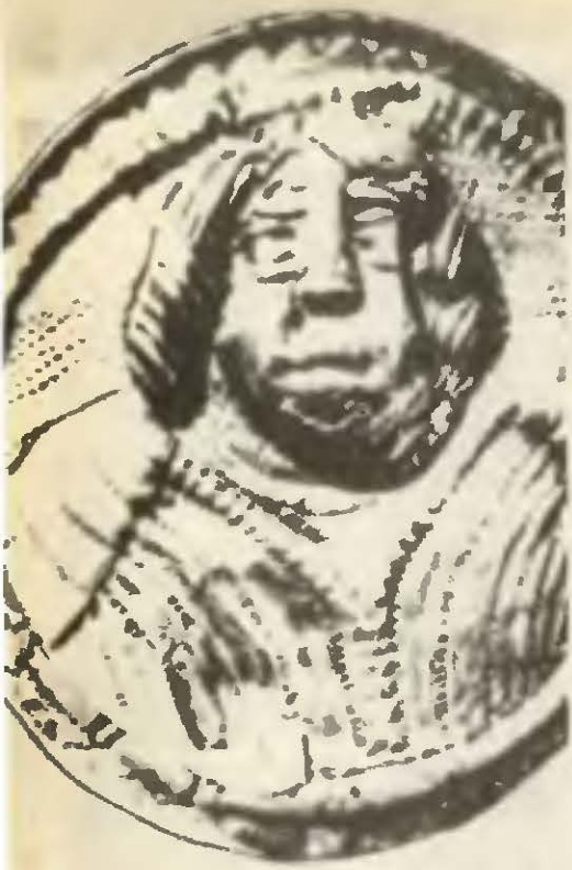
Фibuлы с портретом Буребисты.