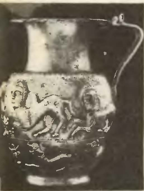
Серебряный сосуд из кладки в Рогозене.

Инженеров и каменщиков из греческих городов Бурбиста использовал для строительства стен в Сармизегетусе и крепостей, густой сетью которых была покрыта Дакия. Стены возведены по греческому образцу, на камнях видны греческие буквы — метки мастеров.