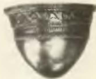
Серебряные сосуды из кладки времен Буребисты.