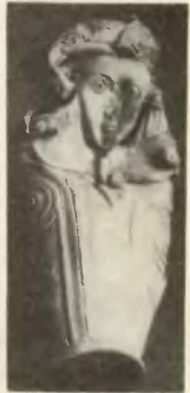
Бляшка из клада в Луковите.