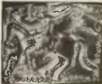
Бляшки конской сбруи из клада в Летнице.