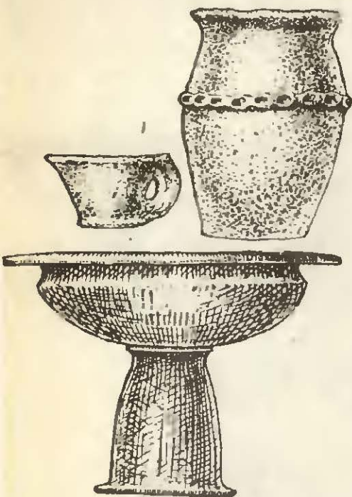
Фракийская керамика: «дакийская кружка», «гетский горшок», «ваза-фруктовница».

Современные румыны и молдаване склонны считать себя потомками даков и гетов. Очевидно, в какой-то мере это так, но язык у них романский, а не фракийский; вероятнее, что они в большей мере потомки тех переселенцев, которые пришли на эти земли из романизированных задунайских провинций бывшей Римской империи уже после эпохи переселения народов. Впрочем, это особая тема, и сейчас обсуждать мы ее не будем. ●