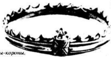
1, 2. Грифы-короны, найденные в районе города Мены, в Черниговской области.

время население даже было вынуждено вернуться к изделиям из камня и кости. Но вскоре было освоено производство железа из местных богатых руд, начался процесс самобытного развития.