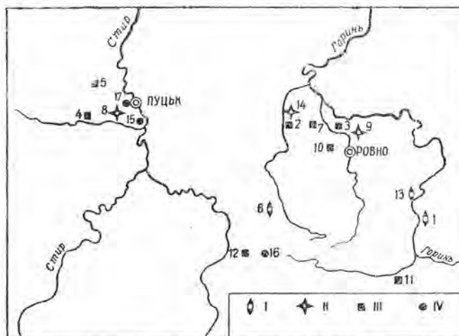
Рис. 1. Схема археологічних пам'яток, обстежених розвідкою Інституту суспільних наук АН УРСР в 1959 р.

На високому березі р. Стубли виявлено крем'яні відщепи і уламки ліпної кераміки, виготовленої з глини з домішкою піску. Вони коричневого кольору з вигладженою поверхнею. Серед них знайшлась частина мисочки з плоским дном, розхиленими стінками і вертикальними вінцями, виділеними невеликим горизонтальним потовщенням (діаметр денця — 10, висота 5,4 см). Мисочка виготовлена з глини з домішкою