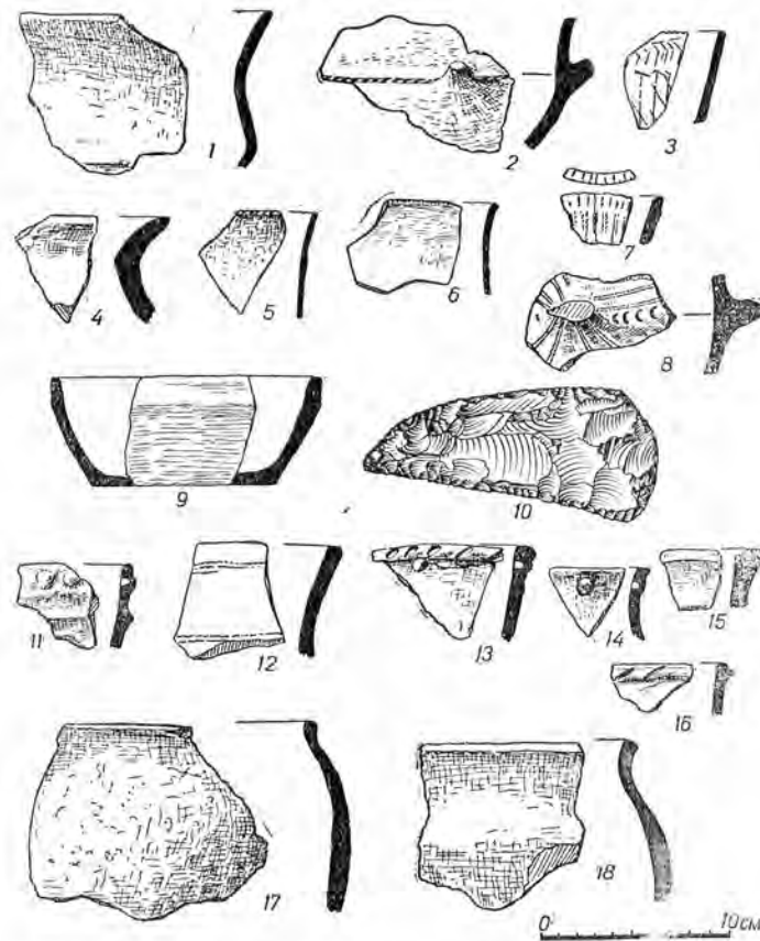
Рис. 2. Археологічний матеріал, знайдений під час розвідки на території Ровенської та Волинської областей.

з слідами ретуші) та фрагменти ліпної кераміки, виготовленої з глини з домішкою піску і шамоту. Колір темно-сірий, поверхня вигладжена. Деякі з них прикрашені відбитками шнурка. Звертає на себе увагу фрагмент стінки чорної посудини з частиною широкої, овальної у розрізі ручки. На рівні ручки нанесені рядки подвійних горизонтальних