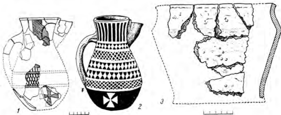
Рис. 18. Сосуды

Это так называемые фризские кувшины ( friesische Kannen , рис. 18, 2). Форма, орнаментация и размеры их (высота 24—26 см) очень устойчивы. Все они сделаны на гончарном круге из тонкой, хорошо отмученной глины. Внутренняя поверхность их, а если сосуд побывал в огне, то и наружная — красно-коричневая. Но у сосудов необгоревших наружная поверхность покрыта каким-то черным составом и орнаментация накладной серебрястой фольгой или белой краской. Узоры составлены из полосок, ромбов, треугольников, сетки, а на придонной части — из крестов типа «георгиевских». Ручка массивная, уплощенная, с продольным пазом. Носик круп-